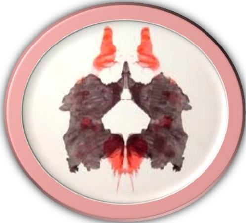
الشكل رقم (٢)

ثالثاً : الطرق الإسقاطية : تعتمد هذه الطرق على أن يطلب من الفرد أن يقوم بإظهار ردّ الفعل تجاه بعض المثيرات المبهمة ، أو غير الواضحة ، مثل : الصور التي يمكن أن تحمل أكثر من معنى وأكثر من عنوان . ومن الاختبارات الشائعة الاستخدام في قياس الدافعية اختبار تفهم الموضوع (T.test) ، أو اختبار بقع الحبر (رورشاخ) كما في الشكل رقم (٢) الآتي :